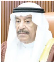
رئيس مجلس الشورى

البالغة، طالما نصب في المنح الإصلاحي والتنموي للمملكة.