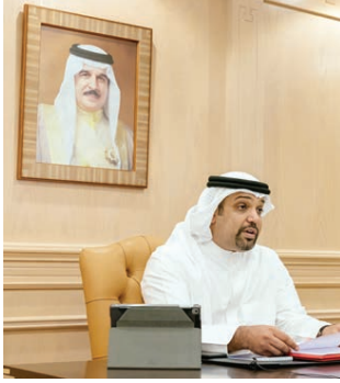
إعداد: محمد الساعي O وزير المالية لدى إلقاء كلمته في اجتماع رئيس مجموعة البنك الدولي. (صورة أرشيفية)