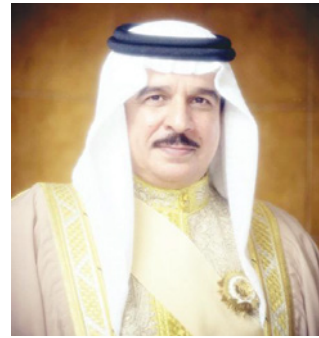
عاهل البلاد المقدي

توقع رئيس مجلس الشورى علي الصالح حزمة مراسيم بقوانين، ومشروعات بقوانين جديدة تواكب متغيرات المرحلة، مبيناً أنه تم اتخاذ كافة الإجراءات الوقائية لعقد الجلسة الأولى داخل القاعة، ومن ثم استمرار انعقاد الجلسات والاجتماعات عن طريق الاتصال المرئي «عن بُعد». وأكد في لقاء مع «الوطن» أن الحاجة باتت ملحة لدى الوزارات والأجهزة الحكومية،