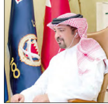
الشيخ أحمد بن حمد

والفعالية في مجال العمل الجماعي لدى دول الأعضاء، موضحاً أنه نظراً للظروف الاستثنائية التي تعقد فيها اجتماعات المنظمة، فإنه يجب توجيه الاهتمام إلى سرعة التعامل مع المواضيع التي تشكل معايير جديدة ومهمة، كال اتصال وتيسير التجارة والتكنولوجيا.